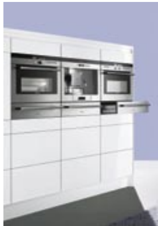
Siemensen Compact 45-konsepti sai vuoden 2008 Design Award -palkinnon tunnustukseksi muotoilustaan.

Kylmäkalusteiden kehittyneiden eristeiden ansiosta energiankulutus on pienentynyt ja pakastimet pystyvät sähkökatkosten sattuessa säilyttämään pakasteet vahingoittumattomina jopa kaksi vuorokautta.