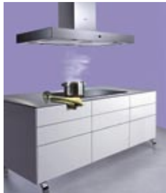
Siemensen 120 cm leveä liesituuletin on omiaan keittosarekeisiin.