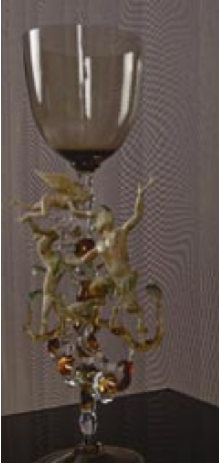
Caro karo -malliston graafiset kuviot muodostuvat vinoiksi taipuvista neliöistä. Mallistossa on sekä pehmeitä murrettuja värejä ja voimakkaita perusvärejä, jotka heijastattelevat kullan ja hopean sävyjä.

Kun ostat tapetit tutustu kaikkiin rullasta löytyviin merkintöihin. Tarkista, että jokaisessa rullassa on sama valmistusnumero. Eri valmistuserien sävyt voivat vaihdella. Huomioi myös kohdistuksen korkeus. Isokuvioisissa malleissa voi kohdistus olla yli puolimetriä, joten tapetin menekki voi olla huomattavasti suurempi kuin vapaasti kohdistettavissa malleissa.