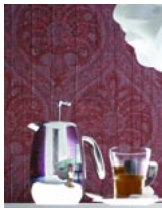
Puolihiimeää damaskimaista Crush Gala -tapettia koristaa itämaiset lehtikuviot. Malliston väreinä on helmiäistä, grafiittia, rubiinipunaista, mustaa, beigeä, valkoista ja lilaa.

Tapetointi onnistuu yksinkin, mutta kaksin se on helpompaa. Varsinkin korkeissa huoneissa toisen nostaessa vuodan ylös voi toinen passata alapäätä suoraksi. Tapetointi sujuu yllättävän nopeasti ja tulosta pääsee ihailemaan jo samana päivänä.