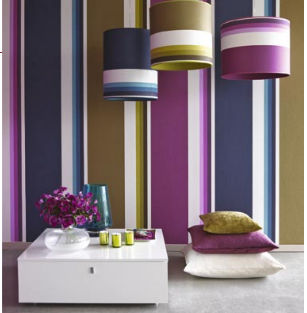
Tähän seinään on yhdistetty erivärisiä raitakuvioisia Supremo-va-kuitutapetteja. Mallistoon kuuluu myös kiiltävää ja himmeää pintaa yhdistäviä tapetteja.

Ennen tapetointia pitää luotilangan avulla merkitä seinään pystyviiva, jonka avulla ensimmäinen vuota saadaan suoraan. Nurkkien suoruteen ei kannata luottaa. Noudata tapetikohtaisia ohjeita liisterin tai liiman määrässä. Mitä painavampi tapetti on sitä paksumpi tulee yleensä liisterin olla. Tapetteja saa myös liisteripohjalla, jolloin ne vain kastellaan. Kuitutapetteja tapetoidessa liisterin voi levittää tapetin asemasta seinään.