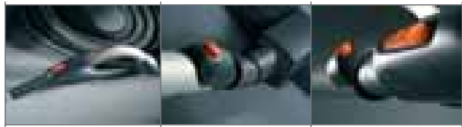
Premium-siivousvälineiden viimeisteltyä ergonomiaa ja muotoilua.