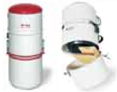
Valinnainen pölypussin asennussarja kaikkiin malleihin.