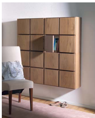
Askon Maxi-lokerikko koostuu neliosaisesta seinälle kiinnitettävästä kaapista, joita voidaan yhdistää isommiksi ryhmiiksi. Tuotetta saa pähkinä- tai kirsikkaviilutettuna.