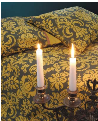
Finlaysonin Klubi-liinavaate-asettiin on haettu vaikutteita barokin loisteesta.