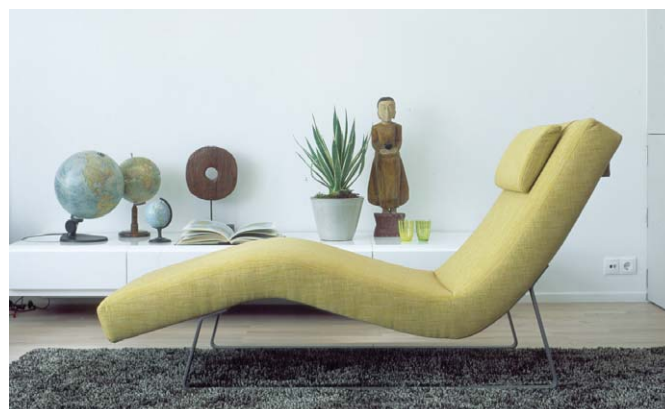
Adean Wave on selkeämuotoinen divaani, jota saa useilla kangasvaihtoehdoilla.

muhkeat laskoverhot joko tummanpunaisesta tai ornamenttikuvioidusta sametista. Myös kuvioidusta puuvillasatiinista saa näyttävät ja kauniisti laskeutuvat sivuverhot.