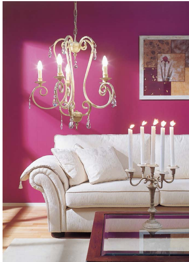
Valaisimista löytyy sisustukseen kauneutta ja romantiikkaa. Kuvan tuotteita myy Asko.