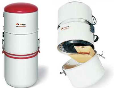
Valinnainen pölypussin asennussarja kaikkiin malleihin.