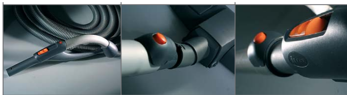
Premium-siivousvälineiden viimeisteltyä ergonomiaa ja muotoilua.