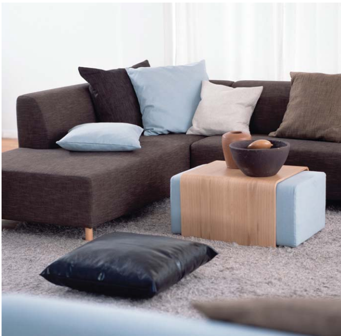
Tehosteväri piristää ruskeaa kokonaisuutta. Adean Camp-moduulikalusteeseen kuuluu myös taivutetusta viilusta valmistetut sohvapöydät.