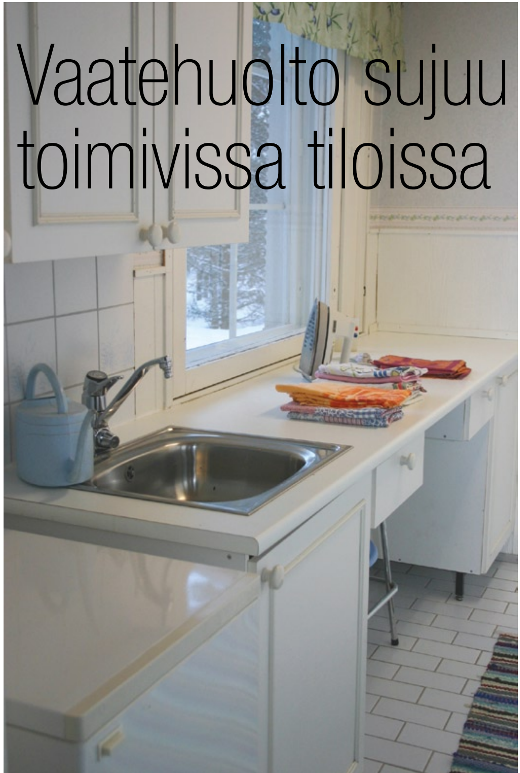
Ikkuna antaa valoa ja viihtyisyyttä vaatehuoltotiloihin.

Parasta on, jos vaatehuollolle pystytään varaamaan aivan oma tilansa. Toimiva ratkaisu saattaa olla myös saunan pukuhuoneen ja vaatehuoltotilan yhdistäminen. Tila saa mielellään olla ikkunallinen ja viihtyisä. Varsin yleistä on sijoittaa vaatehuolto kakkosisäänkäynnin yhteyteen, jolloin märät pyykki saa vietyä helposti ulos kuivumaan muuta asuntoa kastelematta.