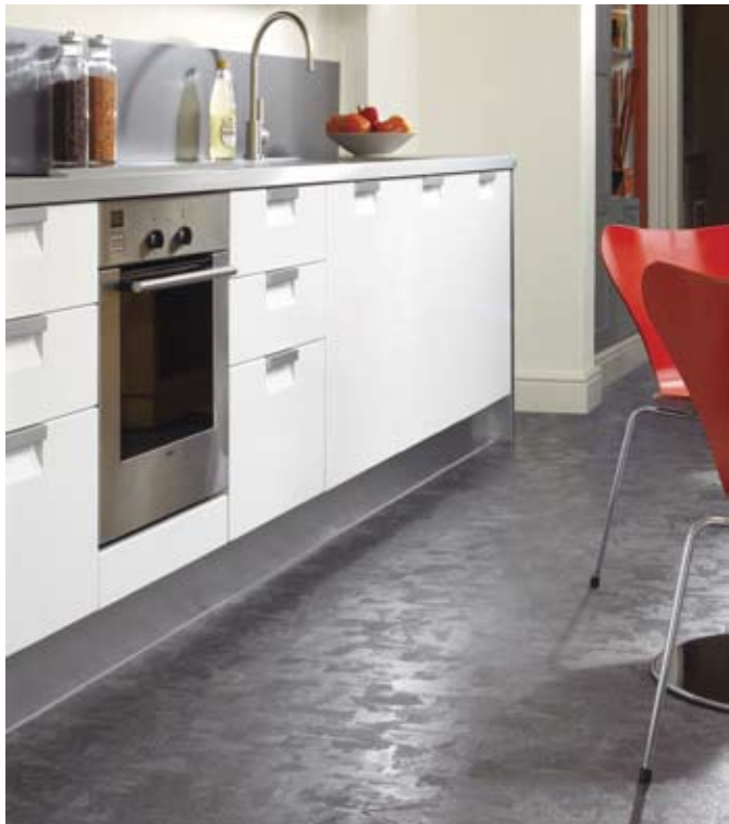
Tarkettin Optic -malliston pinnan martiointi taittaa valoa kauniisti ja tekee lattiasta vivahteikkaan. Kuvan muovimatossa on Pyramide-kuviointi.