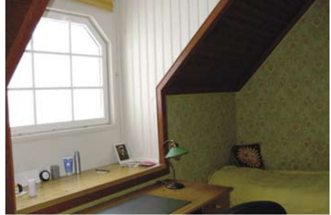
Tämä viehättävä ikkuna on pojan huoneessa yläker- rassa.

Talossa ei ole lainkaan patte- reita, vaikka lämmitysmuotona on sähkö. Salissa ja kolmessa makuuhuoneessa lämpöä antavat sähkövastuksilla varustetut vuolukiviunit. Keittiössä on puulla lämпиävä leivinuuni, yhdessä makuuhuoneessa kattolämmitys ja pesutiloissa lattialämmitys.