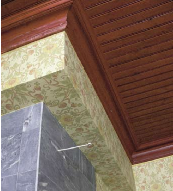
Alkuperäinen katto ja leveät listat paljastuivat sisäkattolevyjen alta.

Muovilattioiden alta paljastuivat lankkulattiat ja sisäkattolevyjen alta vanha kattokorkeus. Remontin jälkeen salin huonekorkeus on jälleen 290 senttiä.