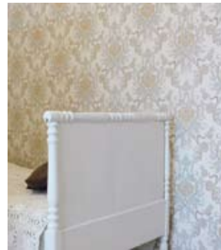
Huoneet on tapetoitu ju- gendtyylisillä suurikuvioisilla tapeteilla ja sisustettu ajan- henkeen sopivilla huone- kaluilla.